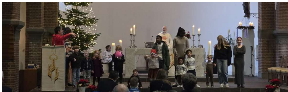
Eerste kerstdag: het kerstverhaal wordt verteld met diapresentatie