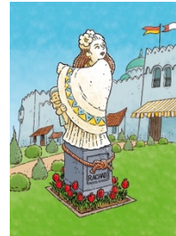
3 e zondag Rachab;