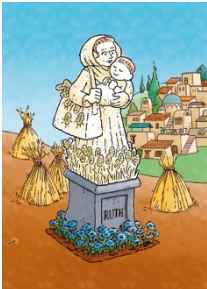
1 e zondag: Batseba;

Kinderkerk is elke zondag tijdens de viering van 10:00 uur. De kinderen komen met hun ouders naar de kerk. Daar neemt de leidster ze mee naar De Bolder, waar de kinderkerk wordt gehouden. Bij de communie komen de kinderen terug in de kerk en als iedereen weer op zijn plaats is, vertellen ze wat ze hebben gehoord en gedaan.