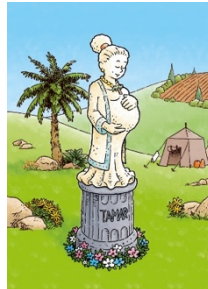
2 e zondag: Ruth;